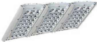
Диора Unit 180/21000 K30 (с решёткой)