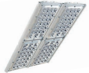
Диора Unit 240/28000 K30 (с решёткой)