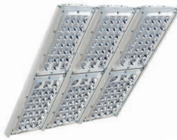
Диора Unit 360/48000 K30 (с решёткой)