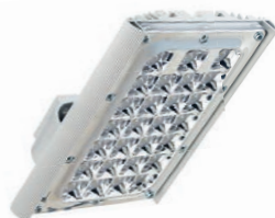
Диора Unit 60/7000 K30 (с решёткой)