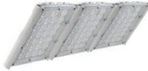
Диора Unit 180/21000 K30