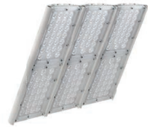
Диора Unit 360/42000 K30