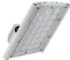
Диора Unit 60/7000 K30