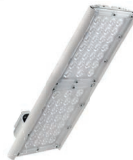
Диора Unit 120/14000 K30

Прим.: Возможные отклонения в заявляемых параметрах светового потока составляют +/- 5 %, мощности +/- 10 %, что связано с различными условиями эксплуатации и параметрами питающей сети. Отклонения значения цветовой температуры, заявляемое производителем светодиодов может составлять +/-10 %.