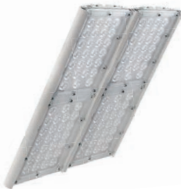
Диора Unit 240/28000 K30