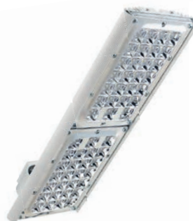
Диора Unit 120/14000 K30 (с решёткой)