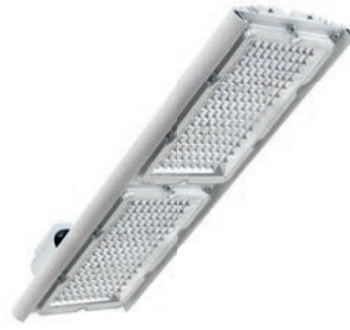
Диора Unit 100/13500 K60