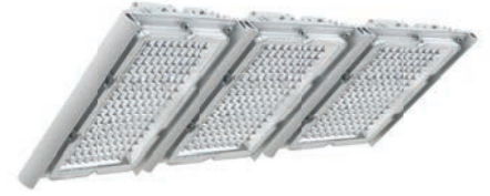
Диора Unit3 135/18000 K60