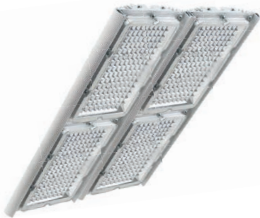
Диора Unit2 200/27000 K60