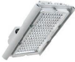
Диора Unit 25/3000 K60